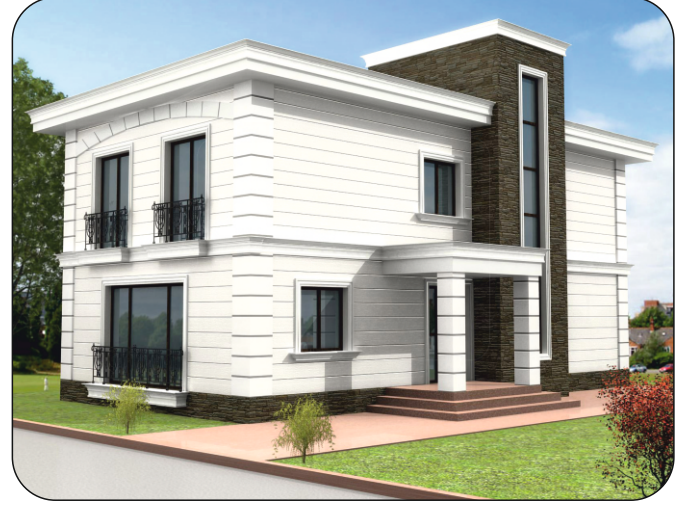
Tuzla - Mercan / Özel Villa