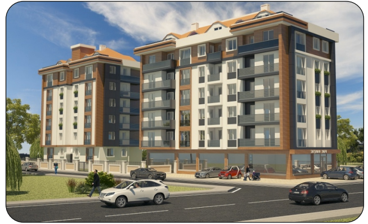
Parkbosna evleri Sapanbağları / Pendik