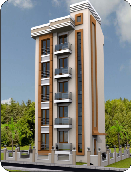
Pendik - Yeni Mahalle Süleyman Türkoğlu İnşaatımız