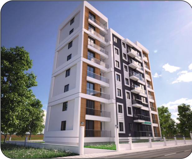
Yeni Mahalle İbrahim Özmert Projesi